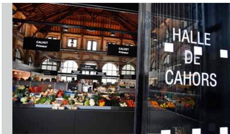
Une halle alimentaire entièrement rénovée en 2019

1 Dynamique, le centre-ville de Cahors propose 500 enseignes commerciales (25% d'enseignes nationales, 75% d'indépendants). Il enregistre une augmentation de ses commerces de 3% depuis 2008 alors que d'autres villes préfecture subissent un recul de leur tissu commercial. Chaque année, le ratio est positif entre les ouvertures et les fermetures, avec un équilibre qui se maintient entre le commerce de centre ville et la périphérie. La dynamique a d'ailleurs été confirmée par plusieurs études nationales récentes menées sur les centres-villes. Elles démontrent la très faible vacance commerciale du centre-ville, plaçant la centralité de Cahors dans le Top 12 des villes de moins de 100 000 habitants pour son faible taux de vacance en hypercentre (- de 7%).