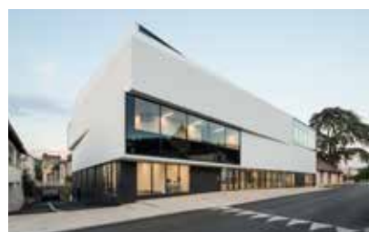
Hôtel Best Western 4 * et Auberge de jeunesse ouverts en 2016 et 2017