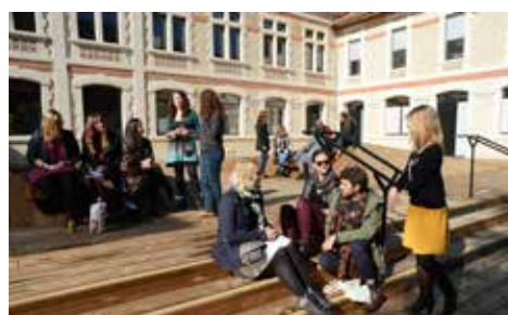
Le campus universitaire entièrement rénové