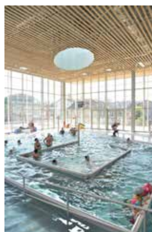
Complexe aquatique Divonéo