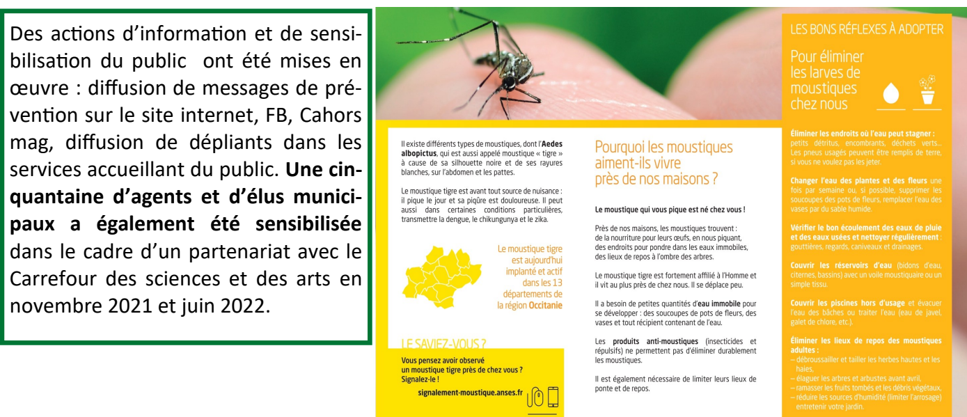
Dépliant de l'ARS diffusé dans les lieux publics de la ville